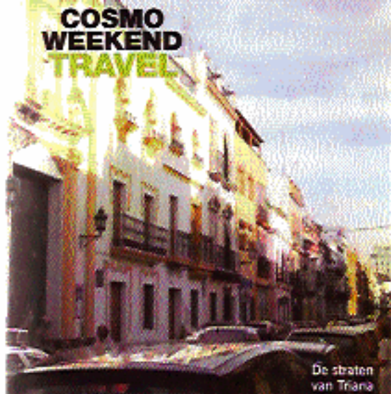
De straten van Triana