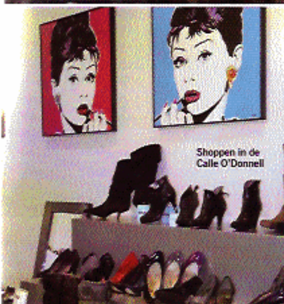
Shoppen in de Calle O'Donnell