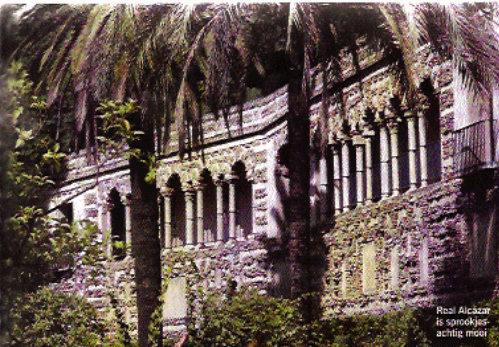
Real Alcázar is sprookjesachtig mooi